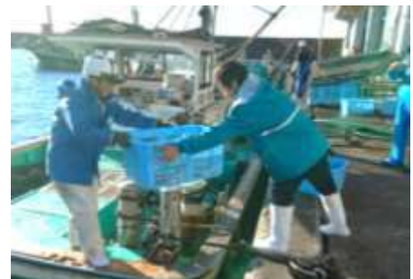
漁師から展示生物の提供 (研修生対応)