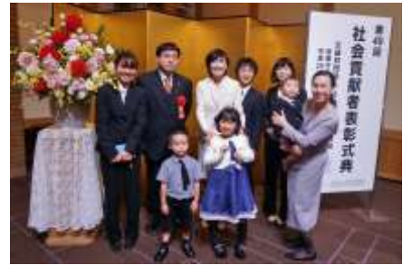
社会貢献者表彰を受賞