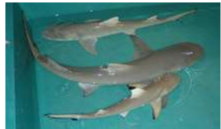
サメの調査をスタート