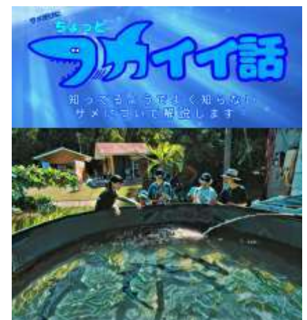
サメのイベントも開催