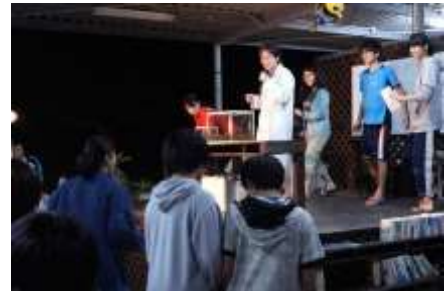
修学旅行でナマコ先生の講義