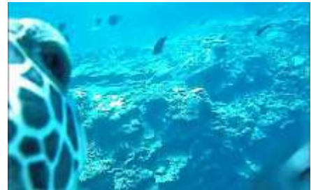
カメにカメラつけました